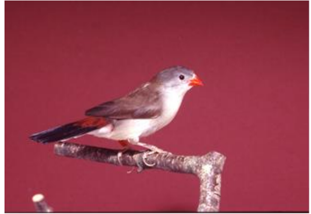
(2) 0,1 Sumpfastrild