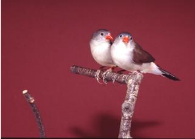
(1) Sumpfastrild 1,1