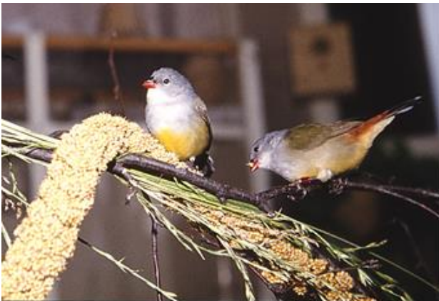
(3) Gelbbauchastrild in der Voliere